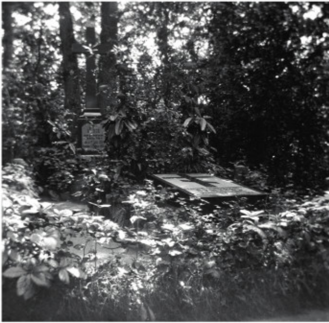
Ил. 2. В. А. Пушкина. Надгробие Г. А. Пушкина. Маркутье, Вильна (Вильнюс), 1906–1910. Целлулоидный негатив (инверсия). LPM 232