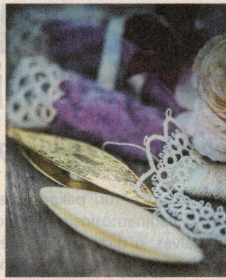
Taip atrodo šėvutės, kuriomis galima nunerti puošnių aksesuarų, servetėlių ir kt.